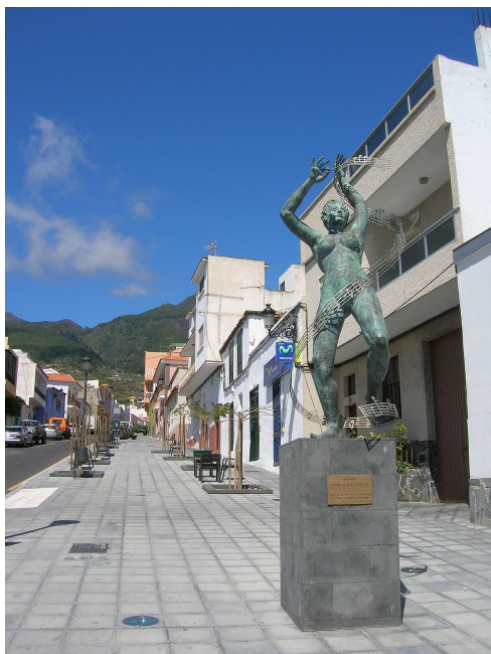
Punkt A (Treffpunkt)